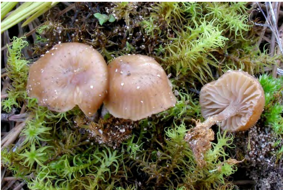
Omphalina galericolor (Romagn.) Bon