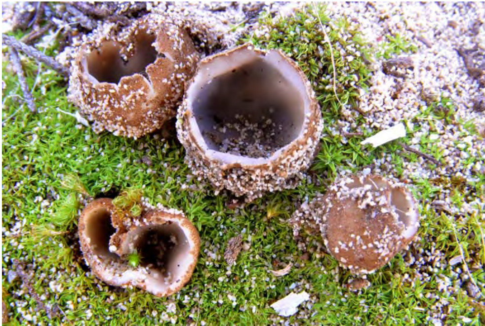
Geopora cervina (Velen.) T. Schumach